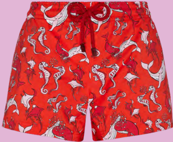
Shorty Femme 165 euros