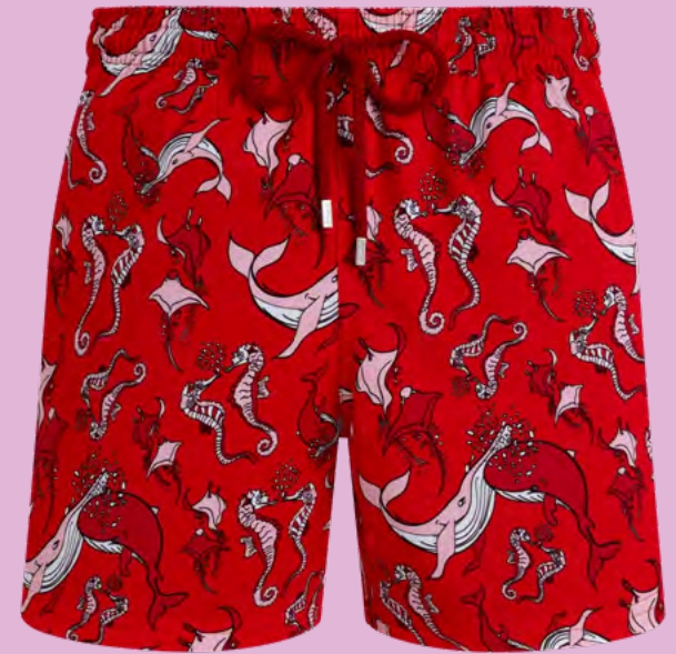
Short de bain Homme 240 euros

Disponible dans les boutiques Vilebrequin et sur www.vilebrequin.com