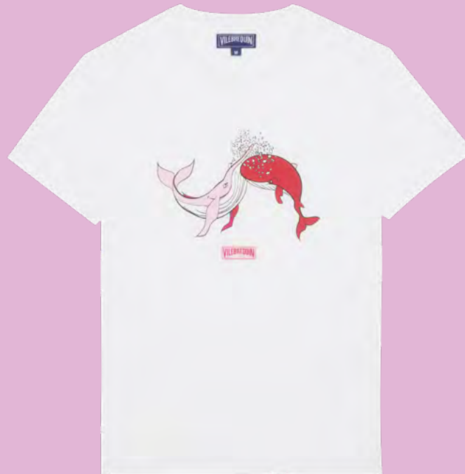
Tee-shirt unisexe 115 euros